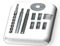
kit fixation inclus