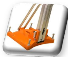
4 boulons de mise à niveau du socle