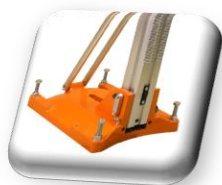
Socle combiné à cheville et à dépression