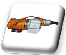
Moteur électrique 3300 W, 230 V, 50-60 Hz